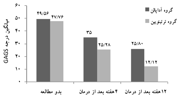
شکل شماره ۲- میانگین درجه GAGS در زمان‌های مختلف در بیماران مورد مطالعه

میانگین گروه درمان با ژل آداپالن ۰/۱ درصد، ۲۵/۰۸ و انحراف استاندارد آن ۹ به دست آمد. همچنین، در گروه درمان با ژل ترتینوئین ۰/۰۵ درصد، میانگین و انحراف استاندارد به ترتیب ۱۲/۱۲ و ۴/۷۱ به دست آمد. آزمون آماری t نشان داد بین دو گروه A و B از نظر درجه GAGS در پایان چهارمین هفته درمان اختلاف معنی دار وجود دارد ( P=0/001 ) و همان‌طور که در شکل شماره ۲ دیده می‌شود میانگین گروه درمانی A بالاتر است.